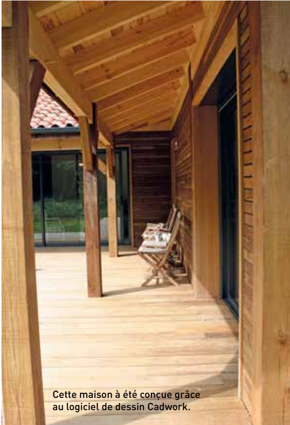
Cette maison à été conçue grâce au logiciel de dessin Cadwork.