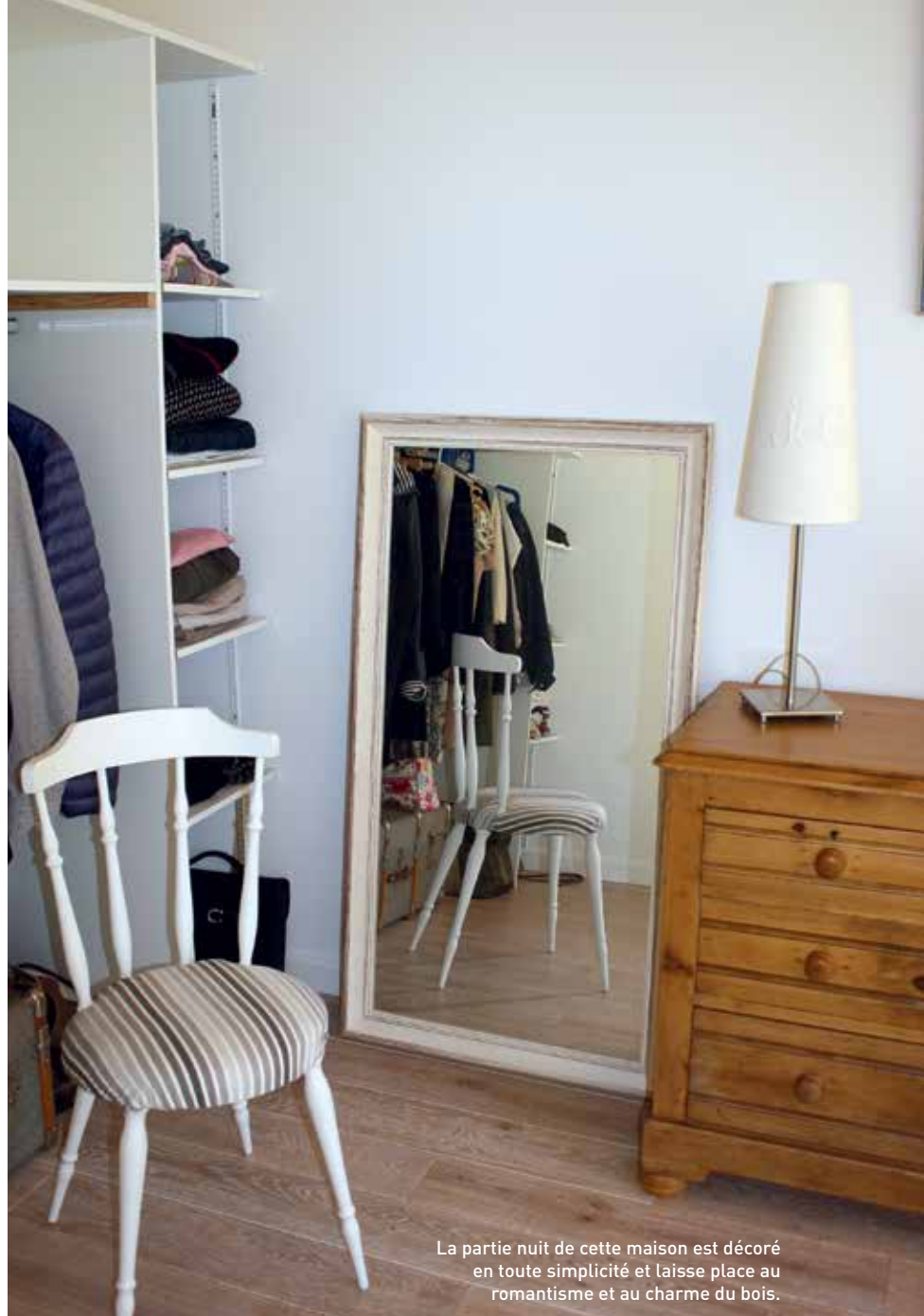
La partie nuit de cette maison est décoré en toute simplicité et laisse place au romantisme et au charme du bois.